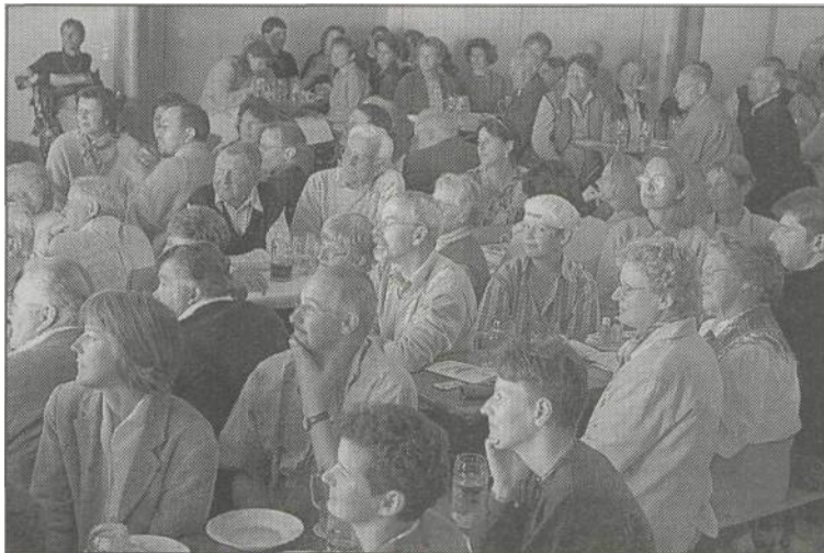
Bis auf den letzten Platz war der Saal im Pfarrzentrum besetzt